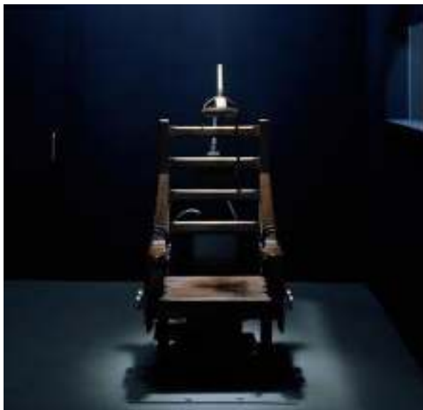
Električna stolica - jedan od najrasprostranjenijih načina za izvršenje smrtne kazne

U Americi se za egzekuciju najčešće upotrebljava električna stolica. Nju je oko 1880.godine konstruisao Edison (pronalazač sijalice), a radi na principu propuštanja struje od nekoliko hiljada volti kroz ljudsko telo. U poslednje vrijeme u svijetu se sve više koristi smrtonosna injekcija koja nakon ubrizgavanja izaziva smrt bez agonije.