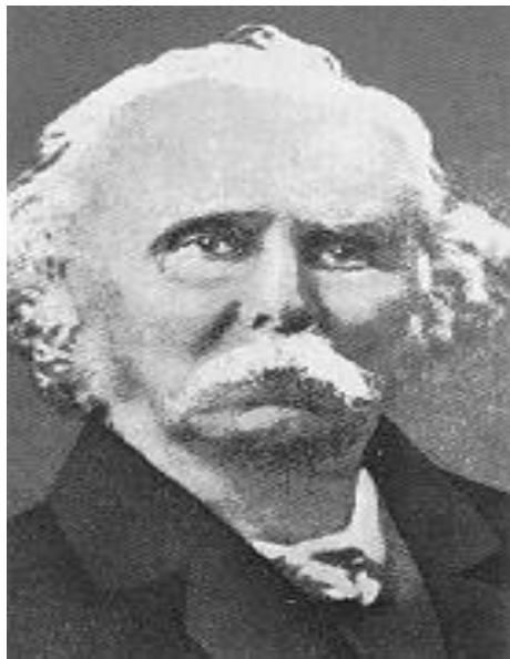
Alfred Marshall (1842.-1924.)